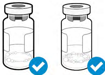
Es aceptable que tenga pequeñas burbujas de aire